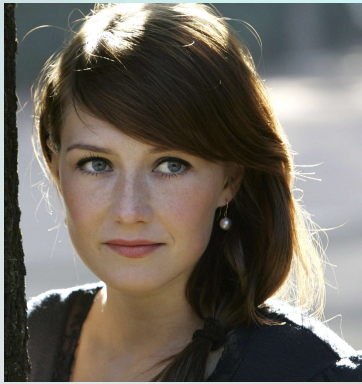
Carice Van Houten Stappertjes