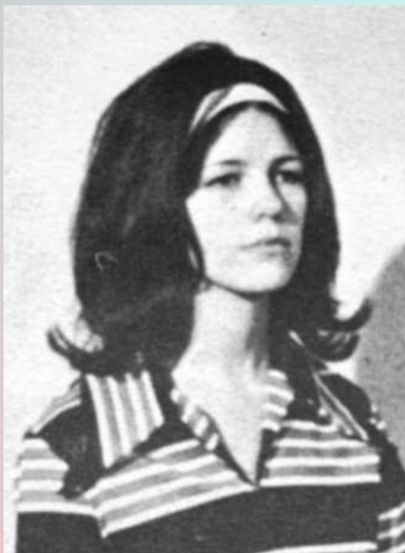
Leslie Van Houten